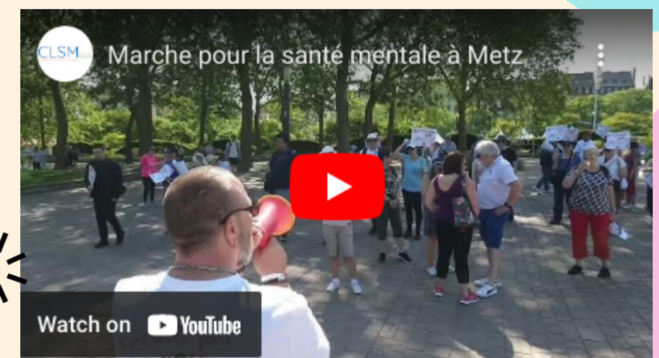
Court reportage de l'événement réalisé par le CLSM