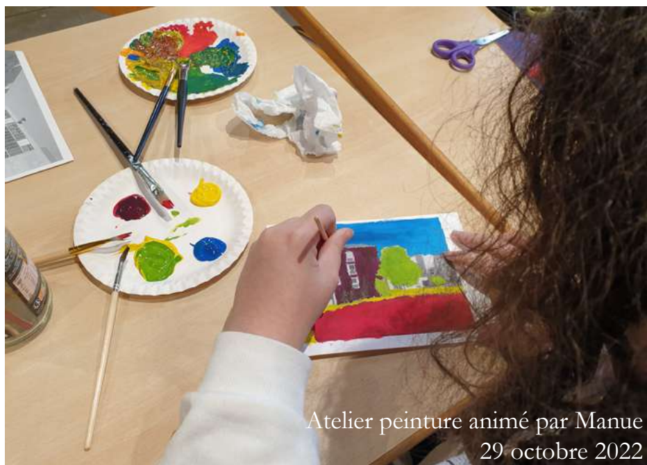
Atelier peinture animé par Manue 29 octobre 2022