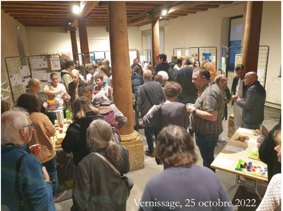
Vernissage, 25 octobre 2022